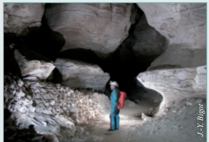
Figure 5 - La grotte d'Aldène conserve encore les témoins de son exploitation comme les murets de pierres édifiés sur les côtés de la galerie.