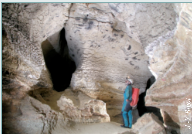
Figure 4 - Fond de la galerie principale: les remplissages du Premier étage de la grotte d'Aldène ont été exploités (phosphates), on en distingue encore la trace dans la partie inférieure de la galerie.